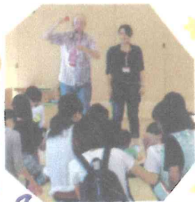
英語の先生とあそんだね!

1年ひひちゃん 教室で楽しく あそんだね。 少しずつ、園に 慣れていく様 子がみられて、 とても うれいです♡