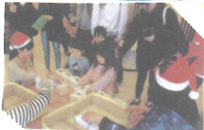
クリスマスにはケキをもらったね♡

1年ひひちゃん 教室で楽しく あそんだね。 少しずつ、園に 慣れていく様 子がみられて、 とても うれいです♡