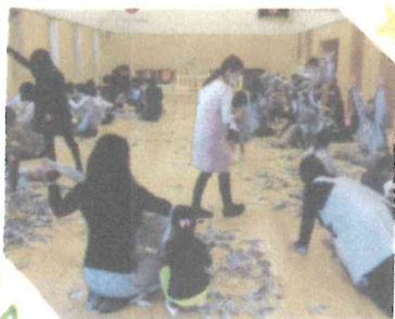
しんぽんをちぎってお山にしたり ボールにしたね!

今日で、今年度のひひちゃん教室はおしまいです。 次に会えるのは入園式ですね。 ひかひかの園服を着て、笑顔で登園できるといいですね。 楽しみに待っています♡