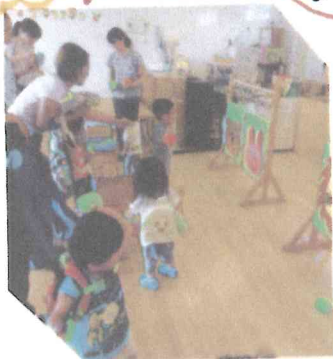
夏はゲームをしたのしかったです!

★ おうちの着替えは自分でできますか? 入園すると、園服の着替えが始まります。先生と一緒に 練習していきますが、おうちでも少し準備しておくといい ですね!!